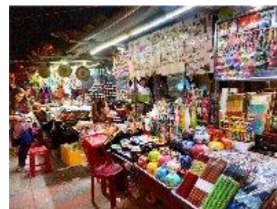
⑤ ナイトマーケット