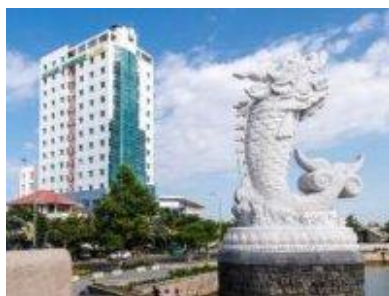
① ホテルとマードラゴン