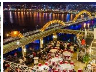
ドラゴンブリッジ