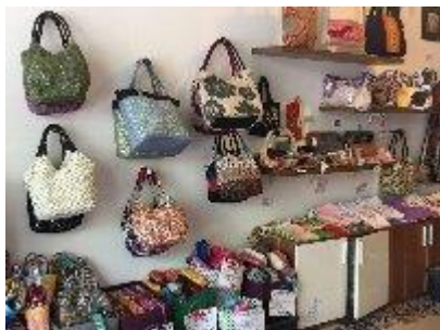
⑧ ホアリーショップ

Bun Cha Ca Hon(ブンチャーカー・ホン)、NHKのテレビに出た店(結局行かなかった)