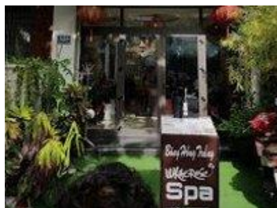
ホワイトローズ・スパ