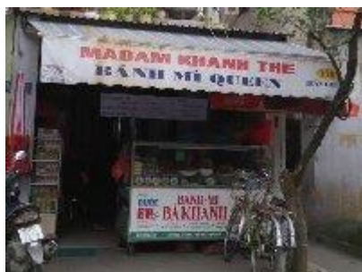
バインミー・クイン