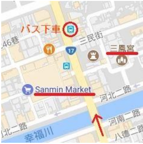
レストラン→三鳳宮へのバスルート