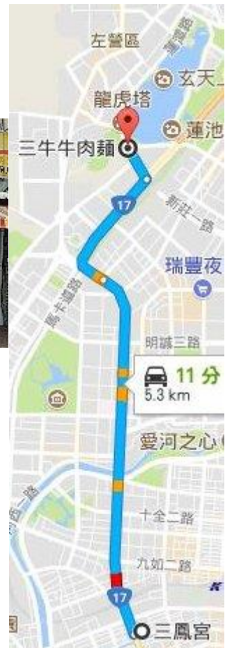
タクシーのルート